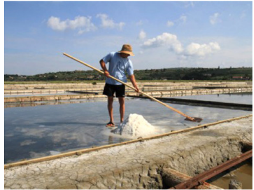
Sečoveljske soline

Po ogledu Postojnske jame bomo pot nadaljevali proti Obali, kjer si bomo v Portorožu najprej privoščili kosilo v hotelu Boutique Portorose, po kosilu pa bomo obiskali Sečoveljske soline , ki so glede na pisne vire stare najmanj sedemsto let. Pradavni način pridobivanja soli oz. solinarjenja, ki so se ga piranski solinarji pred davnimi časi naučili od svojih učiteljev, solinarjev z otoka Paga na Hrvaškem, je še danes nekaj posebnega, tudi v sredozemskem merilu. Tradicionalno ročno pobiranje soli na solnih parcelah ni le posebnost kulturne dediščine sredozemske Slovenije, ampak med drugim zagotavlja razmere, ki omogočajo ohranjanje najpomembnejše naravne dediščine