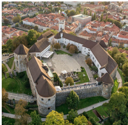
Ljubljanski grad