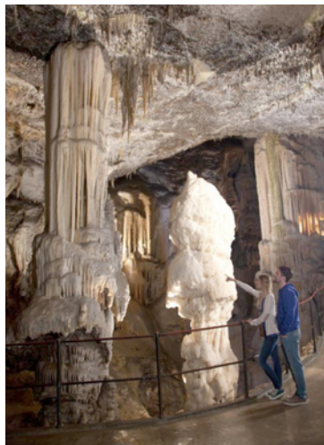
Briljant – najlepši kapnik (stalagmit) v jami

V Postojnski jami živi okrog 150 živalskih vrst: od drobnih pajkcev, zanimivih hroščkov, jamskih vodnih osličkov, kobilic, metuljev, vodnih polžev in netopirjev do človeških ribic , ki so dolge od 25 do 30 cm in so največje jamske živali na svetu. Človeška ribica je repata dvoživka in sodi v starodavno skupino močerilarjev.