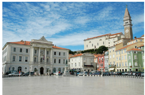
Tartinijev trg

Nad mestom se vzpenja mogočna cerkev sv. Jurija z zvonikom, ki posnema zvonik Markove cerkve v Benetkah. Na osrednjem trgu si bo mogoče ogledati dobro ohranjene ostanke mestnega obzidja, občinsko palačo, mestno ložo, znamenito Benečanko, Tartinijevo hišo in gledališče, sodno palačo, na sredi stoji Tartinijev spomenik, posvečen najpomembnejšemu piranskemu rojaku.