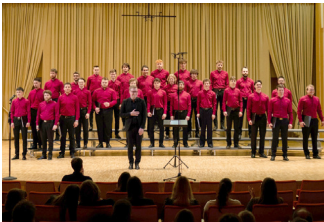
Primorski akademski zbor Vinko Vodopivec

Člani Primorskega akademskega zbora Vinko Vodopivec vseskozi sledijo tradiciji moškega zborovskega petja. Redko se zgodi, da se po pevskih vajah in koncertih takoj razidejo, saj zelo radi zapojejo še kakšno pesem na ulicah in trgih Stare Ljubljane, dekletom v študentskih domovih ali pa v domačih kletah na Primorskem. Zbor, ustanovljen leta 1953, sestavljajo pretežno primorski študentje, ki študirajo na Univerzi v Ljubljani. Od ustanovitve dalje so prepotovali že skoraj vse evropske države, Južnoafriško republiko, dvakrat pa so obiskali tudi Slovence v Severni Ameriki. Poleg tega se redno udeležujejo številnih zborovskih festivalov in tekmovanj na mednarodnih in domačih odrih, njihov zadnji uspeh je iz aprila 2024, ko so na državnem tekmovanju dosegli srebrno plaketo in s tem osvojili naziv najboljšega moškega pevskega zbora v Sloveniji.