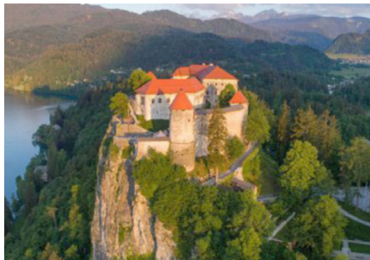
Blejski grad

https://www.bled.si/ , https://www.lovechotel.com/si/ , https://www.blejskiotok.si/ , https://www.blejski-grad.si/sl/ , https://sl.wikipedia.org/wiki/Blejsko_jezero