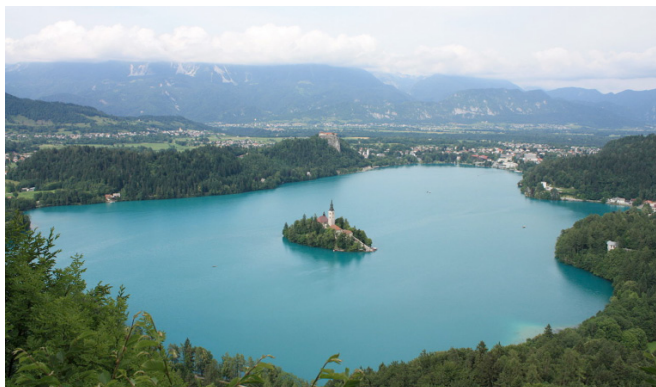
Blejsko jezero z otokom