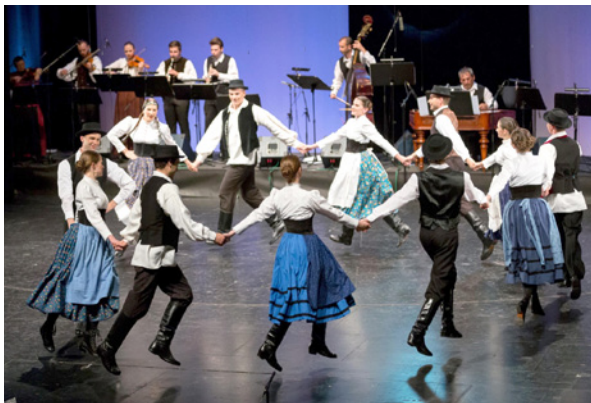
Akademsko folklorno skupino France Marolt

Plesno izročilo Slovencev so oblikovale burne zgodovinske okoliščine in je po svojih koreografskih značilnostih razmeroma enotno, saj je novejšega izvora ter se je v 18. in 19. stoletju na Slovensko razširilo iz sosednjih nemško govorečih držav. Slovenci so nedvomno imeli svoje plesne, toda ko so jih iz neznanih vzrokov izgubili, jih niso ustvarjali na novo, ampak so segli po tujih in jih prilagodili svojemu čutenju in značaju. Starejša plast gibne kulture se je deloma ohranila le še v obrobnih območjih (Rezija, Bela Krajina, Prekmurje, Koroška).