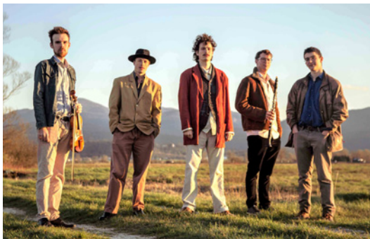
Člani zasedbe Gugutke