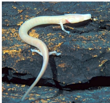
Človeška ribica