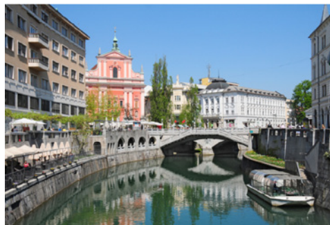
Ljubljanica in Tromostovje

https://www.visitljubljana.com/sl/obiskovalci/