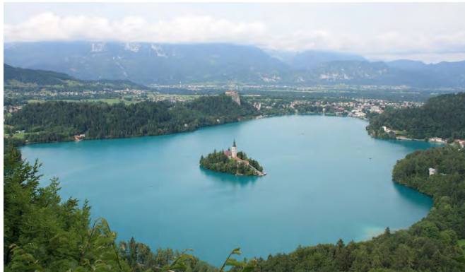
Blejsko jezero z otokom