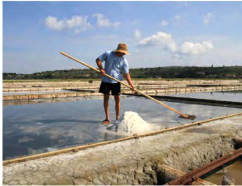
Sečoveljske soline

Po ogledu Postojnske jame bomo pot nadaljevali proti Obali, kjer si bomo v Portorožu najprej privoščili kosilo v hotelu Boutique Portorose, po kosilu pa bomo obiskali Sečoveljske soline , ki so glede na pisne vire stare najmanj sedemsto let. Pradavni način pridobivanja soli oz. solinarjenja, ki so se ga piranski solinarji pred davnimi časi naučili od svojih učiteljev, solinarjev z otoka Paga na Hrvaškem, je še danes nekaj posebnega, tudi v sredozemskem merilu. Tradicionalno ročno pobiranje soli na solnih parcelah ni le posebnost kulturne dediščine sredozemske Slovenije, ampak med drugim zagotavlja razmere, ki omogočajo ohranjanje najpomembnejše naravne dediščine Sečoveljskih solin.