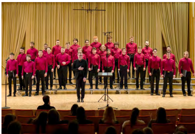
Primorski akademski zbor Vinko Vodopivec

Člani Primorskega akademskega zbora Vinko Vodopivec vseskozi sledijo tradiciji moškega zborovskega petja. Redko se zgodi, da se po pevskih vajah in koncertih takoj razidejo, saj zelo radi zapojejo še kakšno pesem na ulicah in trgih Stare Ljubljane, dekletom v študentskih domovih ali pa v domačih kletah na Primorskem. Zbor, ustanovljen leta 1953, sestavljajo pretežno primorski študentje, ki študirajo na Univerzi v Ljubljani. Od ustanovitve dalje so prepotovali že skoraj vse evropske države, Južnoafriško republiko, dvakrat pa so obiskali tudi Slovence v Severni Ameriki. Poleg tega se redno udeležujejo številnih zborovskih festivalov in tekmovanj na mednarodnih in domačih odrih, njihov zadnji uspeh je iz aprila 2024, ko so na državnem tekmovanju dosegli srebrno plaketo in s tem osvojili naziv najboljšega moškega pevskega zbora v Sloveniji.