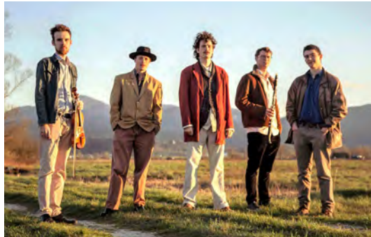
Člani zasedbe Gugutke