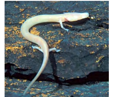
Človeška ribica