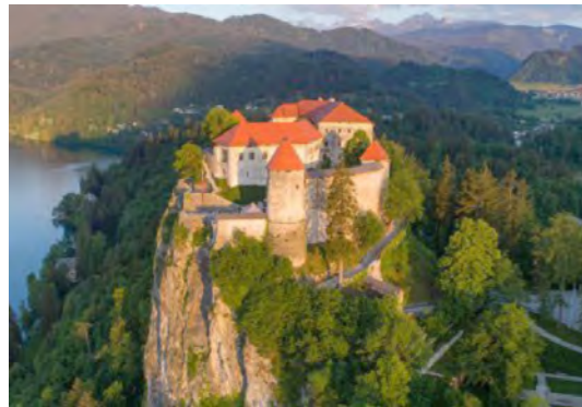
Blejski grad

https://www.bled.si/ , https://www.lovechotel.com/si/ , https://www.blejskiotok.si/ , https://www.blejski-grad.si/sl/ , https://sl.wikipedia.org/wiki/Blejsko_jezero