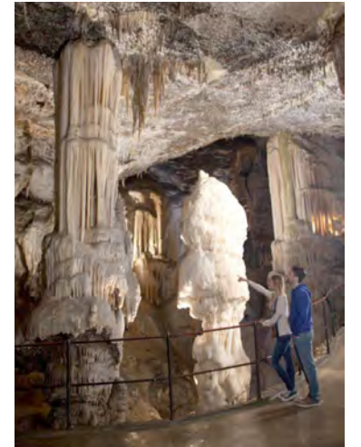
Briljant – najlepši kapnik (stalagmit) v jami

V Postojnski jami živi okrog 150 živalskih vrst: od drobnih pajkcev, zanimivih hroščkov, jamskih vodnih osličkov, kobilic, metuljev, vodnih polžev in netopirjev do človeških ribic , ki so dolge od 25 do 30 cm in so največje jamske živali na svetu. Človeška ribica je repata dvoživka in sodi v starodavno skupino močerilarjev.