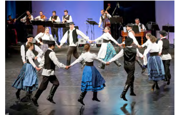
Akademsko folklorna skupina France Marolt

Plesno izročilo Slovencev so oblikovale burne zgodovinske okoliščine in je po svojih koreografskih značilnostih razmeroma enotno, saj je novejšega izvora ter se je v 18. in 19. stoletju na Slovensko razširilo iz sosednjih nemško govorečih držav. Slovenci so nedvomno imeli svoje plesne, toda ko so jih iz neznanih vzrokov izgubili, jih niso ustvarjali na novo, ampak so segli po tujih in jih prilagodili svojemu čutenju in značaju. Starejša plast gibne kulture se je deloma ohranila le še v obrobni območjih (Rezija, Bela Krajina, Prekmurje, Koroška).