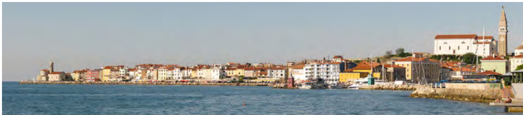
Piran (vir: https://sl.wikipedia.org/wiki/Piran )

Ekskurzijo bomo zaključili v slikovitem mediteranskem mestecu Piran , kjer bomo poletno popoldne preživeli v morju, na soncu ali v senci piranskih plaž. Če vas slana voda ne bo mikala, se boste lahko odpravili tudi na enourni kulturnozgodovinski sprehod po Piranu, največjem biseru med slovenskimi obmorskimi mesti. Piran je na območju, kjer avtohtono živijo pripadniki italijanske narodne skupnosti in kjer je poleg slovenščine uradni jezik tudi italijanščina.