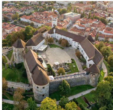
Ljubljanski grad