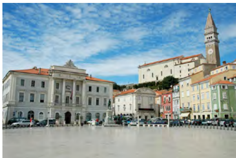
Tartinijev trg

V Ljubljano se bomo vrnil v poznih večernih urah.