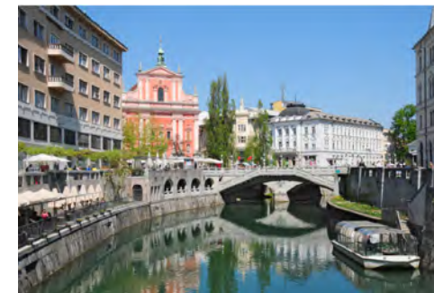
Ljubljana in Tromostovje

https://www.visitljubljana.com/sl/obiskovalci/