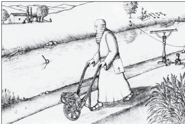
Slika 2: Leonardo de Vinci izvaja meritve hitrosti vode v vodotoku