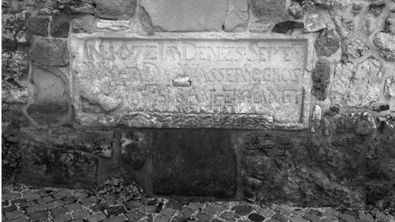
Slika 5: Kamnita plošča z napisom kot spomin na poplavo leta 1672 v Celju

leta 1851. Te oznake nas opominjajo na poplavno nevarnost in na nujnost upoštevanja omejitev pri načrtovanju rabe prostora. Kljub temu da se zavedamo poplavnih tveganj in dejstva, da živimo na poplavnih območjih, pa nas poplave vedno znova presenetijo.