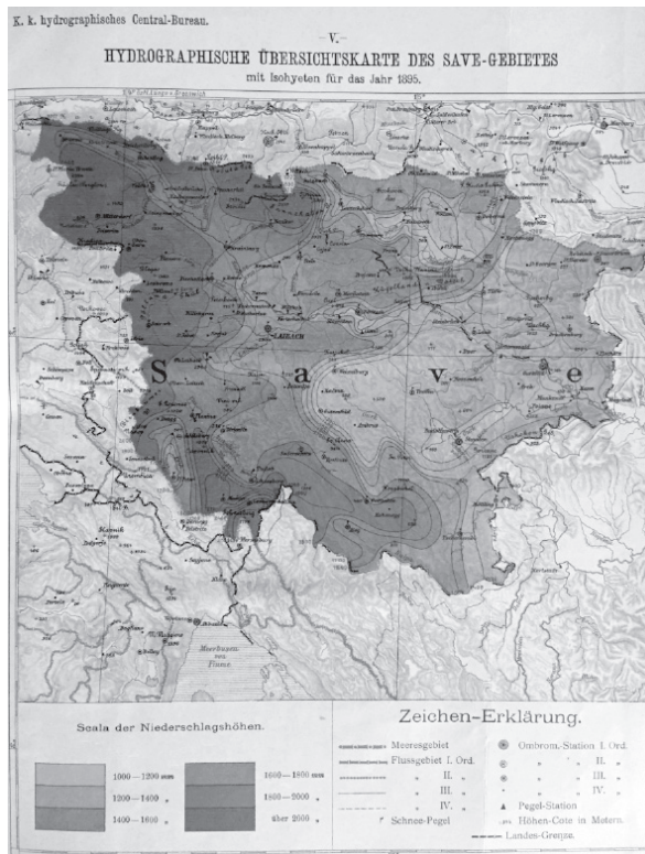
Slika 4: Padavinska karta za porečje Save na slovenskem ozemlju za leto 1895; na karti so vrisane tudi padavinske in vodomerne postaje ( Jahrbuch des hydrographischen Central-Bureaus, Jahrgang 1895 )

Prvi zapisi o delovanju vodomernih postaj na ozemlju današnje Slovenije segajo v leto 1850 (Bat 2008: 27–34). Postavljene so bile na večjih rekah, kakor so Sava, Drava, Mura, Savinja in Ljubljanica, pri čemer na večini teh lokacij meritve potekajo še danes. Organiziran razvoj hidrološke službe se je začel v času Avstro-Ogrske z ustanovitvijo Centralnega hidrografskega urada na Dunaju leta 1893. Urad je zbiral podatke in jih objavljaj v hidrografskem letopisu Jahrbuch des hydrographischen Zentralbureaus (1895–1918). Pred začetkom prve svetovne vojne je na ozemlju današnje Slovenije delovalo približno 130 vodomernih postaj, od katerih so bile nekatere že opremljene z napravami za neprekinjeno zapisovanje višine vodne gladine. Hidrografska dejavnost je bila v času Avstro-Ogrske dobro organizirana in na visoki ravni, kar kaže tudi izsek hidrografskega letopisa za leto 1895 za porečje Save na slovenskem ozemlju (Slika 4).