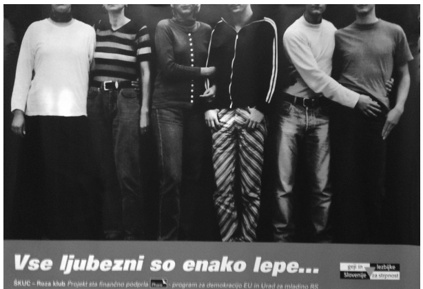
Slika 1: Vse ljubezni so lepe ...

Pred skoraj dvajsetimi leti, januarja 1998, je Roza klub, takratno združenje gejevskih in lezbičnih organizacij v Sloveniji, lansiral plakatno akcijo z naslovom Vse ljubezni so enako lepe . Na plakatu so bili trije pari – lezbični, gejevski in heteroseksualni – čeprav je bilo to skorajda težko opaziti, saj so bili obrazi vseh šestih ljudi na plakatu odrezani, da si ne bi ustvarili vnaprejšnjih sodb. Ta plakat je bil ena od bolj odmevnih političnih akcij gejevske in lezbične skupnosti v Sloveniji do tistega časa, ki se v boju za enake pravice sklicuje na ljubezen. Morda je bil plakat še toliko bolj odmeven, ker je bil takoj deležen grafičarskih dodatkov. A ti niso bili, kot bi na prvo zogo pričakovali, homofobni. Na plakat je namreč nekdo pripisal zgolj črko »s« pred pridevnik lepe: »Vse ljubezni so enako slepe.«