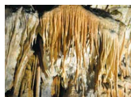
Na Notranjskem ali Primorskem.