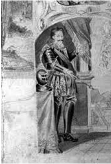
Herman II. Celjski