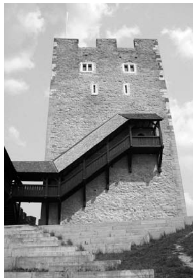
Friderikov stolp na Celjskem Starem gradu

Največjo moč so Celjski pridobili v času Hermana II. Tako se je njegovo zaveznitvo z vplivnim kraljem Sigismundom Luksemburškim, ki ga je Herman II. rešil v vojni s Turki, obrestovalo s poroko njegove sestre Barbare Celjske, kasneje češke kraljice, in s povišanjem Celjskih v državne kneze. V času njegovega vladanja so se Celjski merili celo s habsburško monarhijo, vendar jim nadaljnja vladarska pot ni bila usojena; imeli so preveč sovražnikov in premajhno podporo