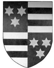
Grb Celjskih knezov

Stari grad se dviga nad Celjem na levem bregu reke Savinje, kjer se bohota na mogočni skali v bližini zavoja reke Savinje in sotočja z Voglajno. Vovržani so ga postavili v drugi polovici 12. stoletja ali ob začetku 13. stoletja, po izumrtju te družine pa je v 14. stoletju prešel v roke Žovneške gospode, ki se je kasneje, po selitvi z gradu Žovnek v Braslovčah v Savinjski dolini v Celje, preimenovala v Celjske gospode. Celjski so se na družbeni lestvici vzpenjali več kot dvesto let in se dejavno povezovali z evropskimi vladarskimi družinami. Tako je med drugim Ana Celjska postala poljska kraljica, hčerka grofa Hermana II., Barbara Celjska, pa po poroki s kraljem Sigismundom Luksemburškim češka kraljica. Največjo slavo so Celjski dosegli v času vladanja grofa Hermana II., in sicer leto dni po njegovi smrti, ko je kralj Sigismund Luksemburški leta 1436 v državna kneza povišal Friderika II. in njegovega sina Ulrika II. Zato tudi v današnjem času rodbina Celjskih knezov velja za najpomembnejšo v zgodovini Slovenije. Njihova slava, potem ko so postali državni knezi, pa je sicer trajala le dve