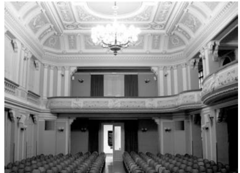
Dvorana Narodnega doma