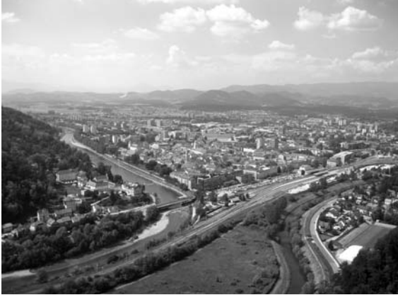
Pogled s Celjskega gradu na mesto in Spodnjo Savinjsko dolino

Pomembno obeležje starih časov je celjski Stari Grad, ki je obiskovalcem dobro viden z vseh strani mesta.