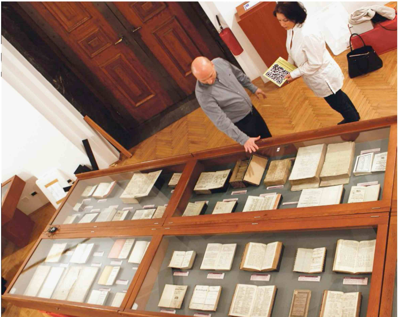
Razstavna dvorana v Nuku bo do 30. januarja ena bolj zavarovanih v Sloveniji, saj so razstavljene tudi zelo dragocene knjige.